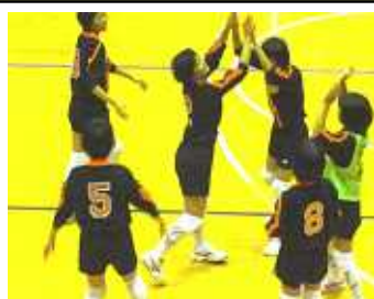
(出雲地区大会で頑張れ)